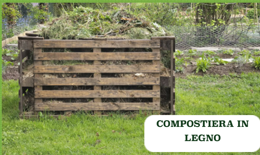
COMPOSTIERA IN LEGNO