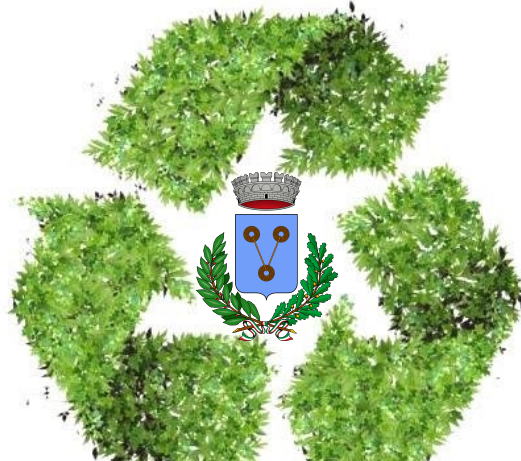
Comune di Tigliole